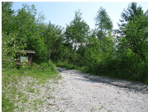
Bacheca informativa a monte della piazzola

Gli interventi proposti consistono nella realizzazione di una piazzola d'atterraggio di emergenza per elicotteri in località Pagherina del Blè, ad una quota di 640 mt slm.