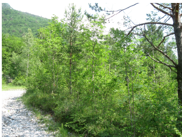
Area in cui verrà realizzata la piazzola d'atterraggio

1. Realizzazione piazzola d'atterraggio elicottero AIB (cfr tavola allegata).