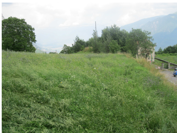
Area in cui verrà realizzata la piazzola