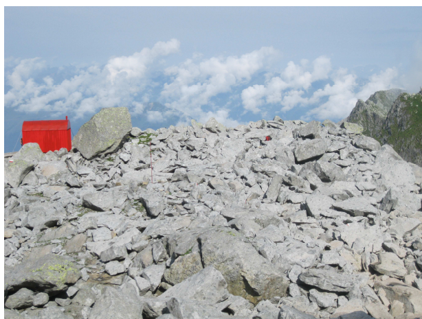
Area in cui verrà realizzata la piazzola