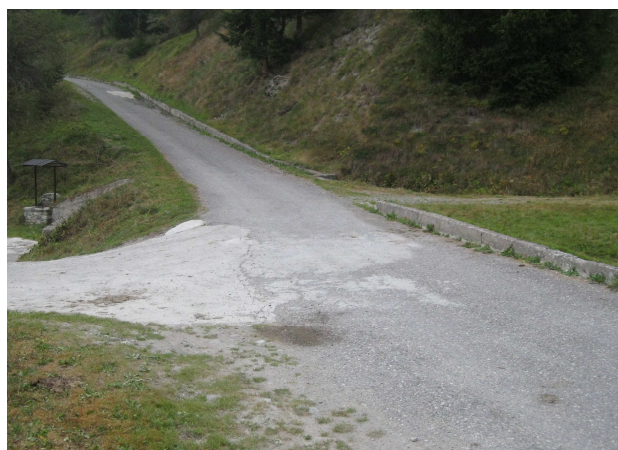
Localizzazione Pozzetto n. 1

Gli interventi in progetto consistono nella realizzazione di n. 4 punti di approvvigionamento idrico con portata costante predisponendo n. 4 un pozzetti (60X60) + bocchetta AIB UNI 45 , su tratti di acquedotti rurali.