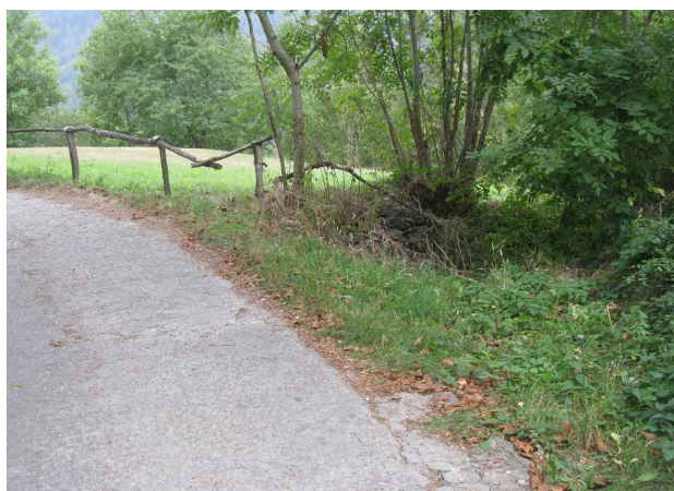
Localizzazione Pozzetto n.2