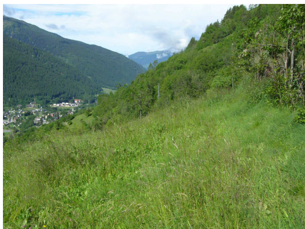
Area in cui verrà realizzata la piazzola