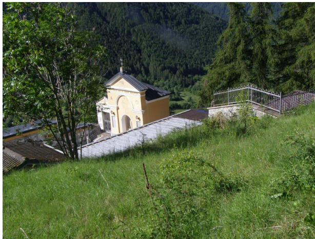
Scarpata a valle dell'area

L'intervento proposto consiste nella realizzazione di una piazzola d'atterraggio di emergenza per elicotteri in località Cimitero di Villa d'Alegno, ad una quota di 1400 mt slm.