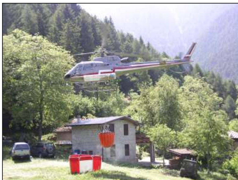
Illustrazione dell'Attività A.I.B. 2019/2020 e Documento programmatico per il 2020/2021