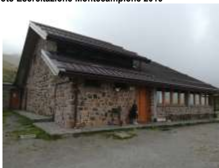
Foto Esercitazione Montecampione 2019